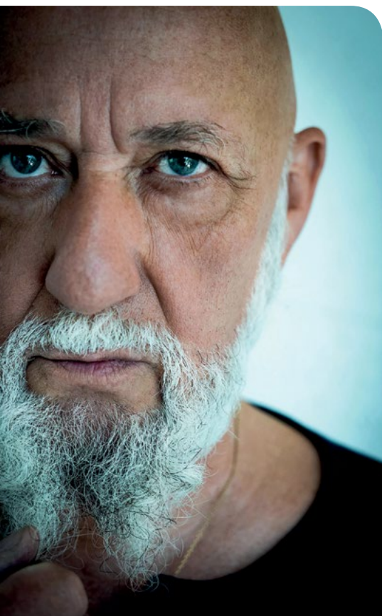
▲ © CharlÉlie - Mai 2020